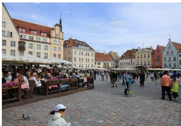
Rådhuspladsen i Tallinns Old Town. Temperaturen vil være lidt lavere, når vi kommer i februar.

Der er ikke inkluderet nogen forsikringer, hverken sygdomsafbestillingsforsikring, rejsegodsforsikring eller andet. Jeg anbefaler en sygdomsafbestillingsforsikring (som ofte er inkluderet i din husstands-forsikring). Undersøg selv hos dit eget forsikrings-selskab, hvordan du er forsikret.