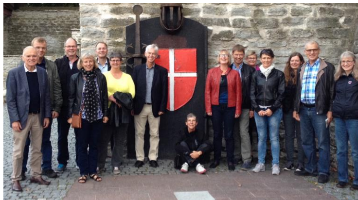
Den Danske Konges Have i Tallinn, hvor Dannebrog faldt ned fra himlen i 1219. Fra seneste rejse til Estland.